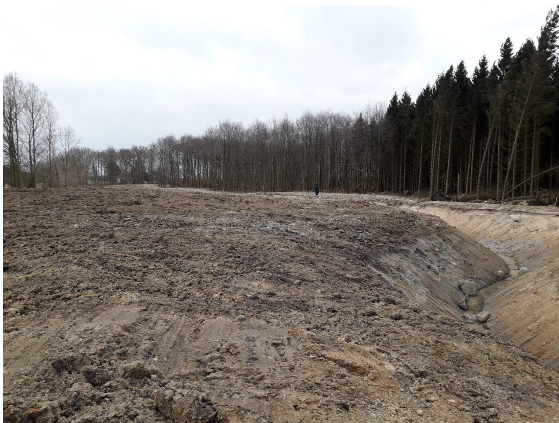
Udsigt over den genslyngede strækning langs Tvedevænge Skov