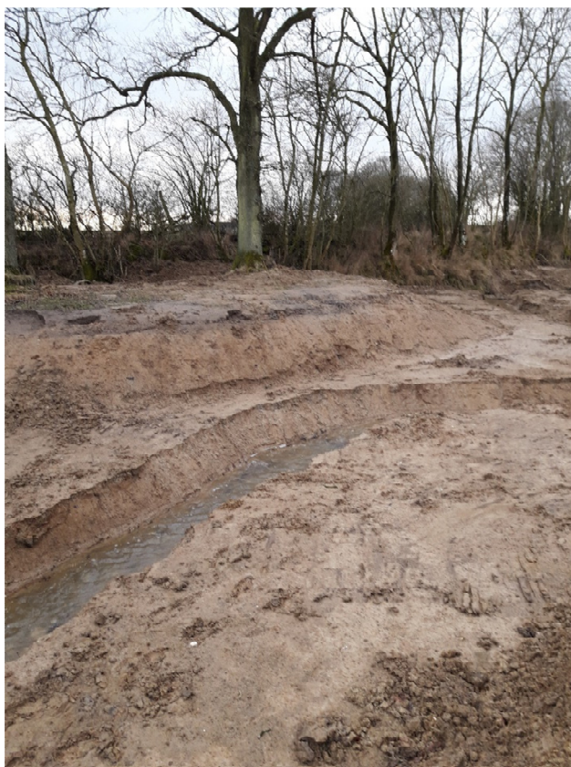
Nyt forløb i miniåal.