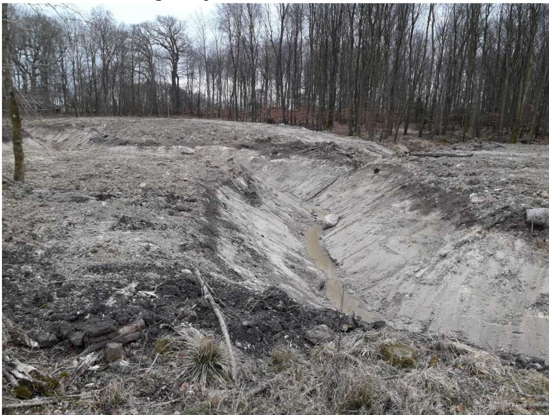
Kig ned igennem noget af den nye ådal på de nye slyngninger og store udlagte sten.