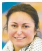
Sahre Buruk Næstved Tyrkiske Kulturforening

Oprindelsesland: Irak - Kurdistan. Jeg har Ph.d. i mikrobiologi. Jeg er gift og har tre børn. For mig er uddannelse et vigtigt element til integration. Jeg ønsker at skabe kommunikation mellem de mange forskellige kulturer.