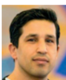
Idris Farzad Danske-Afghansk forening ved Næstved

Jeg er oprindeligt fra Somalia, 33 år og arbejder i dag som Forskningsbioanalytiker. Integrationsrådet repræsenterer jeg den Somaliske forening i Næstved, hvor vi ønsker at bidrage til fællesskabet.