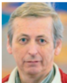
Ole Hardt Den Filippinske klub

Jeg har været Formand for serbisk forening "Djerdap" siden 2008. Til daglig er jeg trafikchef i Nobina Danmark A/S. Det er vigtigt, at Integrationsrådet også består af mennesker, der selv er blevet integreret, og jeg vil meget gerne bringe min viden og mine erfaringer i spil i Integrationsrådet i Næstved Kommune.