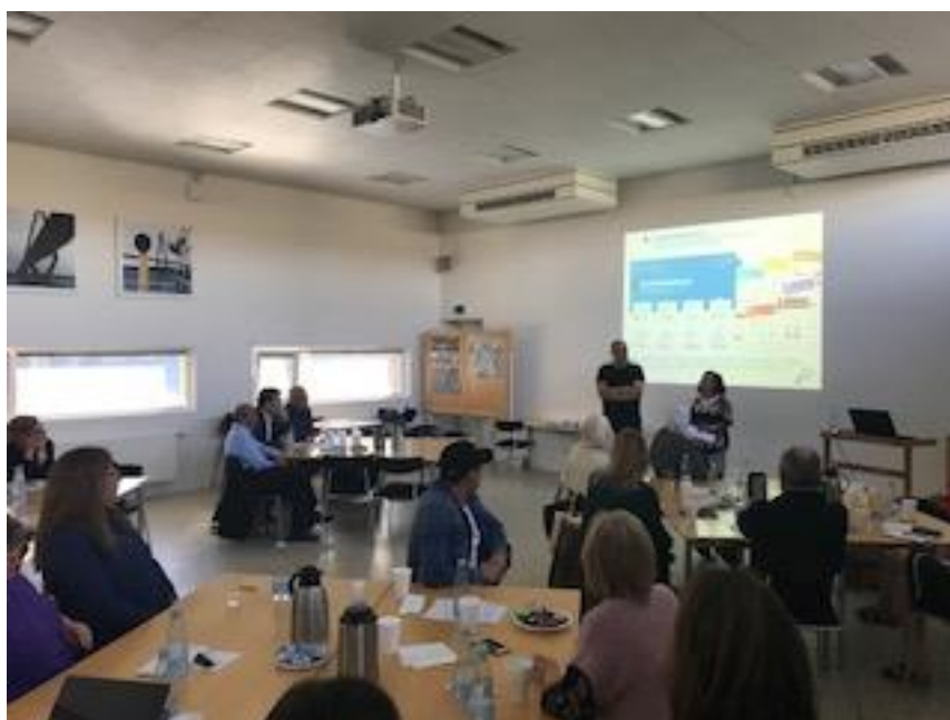
Formanden for Integrationsrådet i Vordingborg byder velkommen til fællesmødet den 25. april

Fællesmødet den 25. april var det første i en række af kommende fællesmøder mellem Integrationsrådene i Vordingborg, Lolland, Ringsted og Næstved.