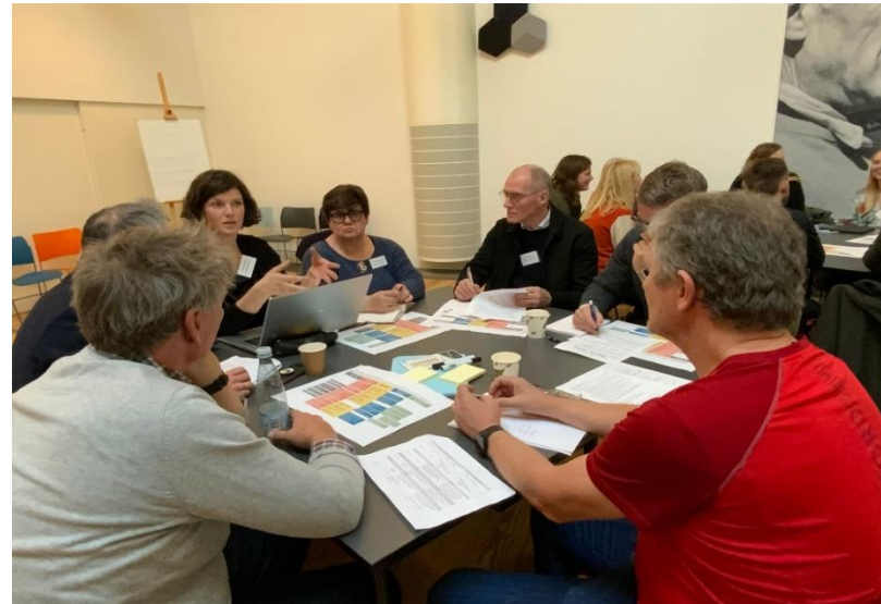
Holmegaard Værk 08. november 2022

Den organiske vækst og udvikling står i centrum, når der skal udvikles et dansk-tysk samarbejdsprojekt, dvs. lige fra de indledende møder til et netværks- og mobiliseringsprojekt og endeligt til et egentligt samskabende samarbejde, der udarbejder fælles løsninger på regionale udfordringer. Den strategiske faciliteringsproces på tværs af tid og projekter skaber forankring, resiliens og muligheden for at få de rette aktører med de rette kompetencer til at drøfte og udvikle forventninger, ansvar, organisering og aktiviteter. Ved "at skynde sig langsom" skabes de bedste forudsætninger for et succesfuldt projektpartnerskab, der kan løfte et 3-årigt strategisk samarbejdsprojekt.