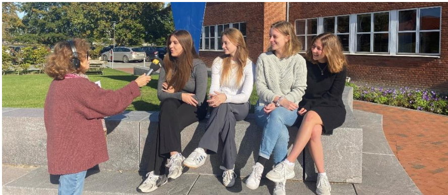
DR P4 interviewer elever fra Næstved Gymnasium, der deltager i et dansk-tysk samarbejde finansieret af Interreg-projektet kultKIT2