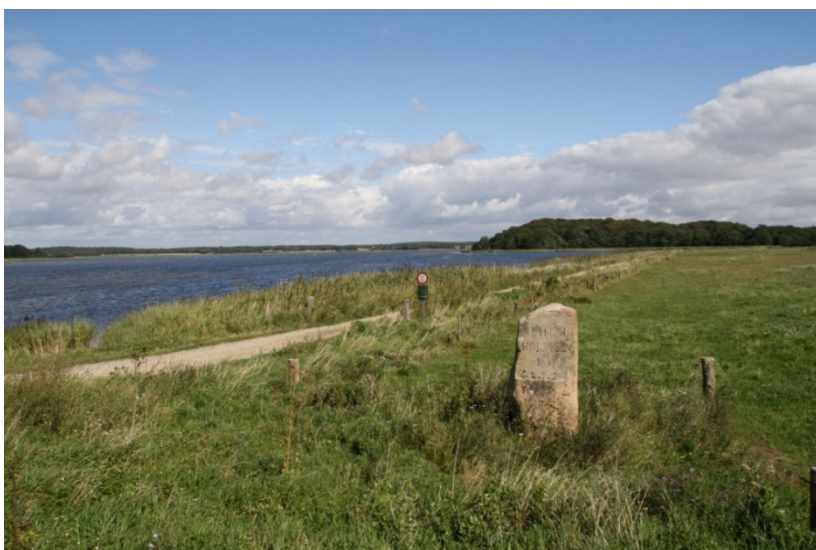
Græssede strandenge ved Holsteinborg Nor

Natura 2000-område nr. 162 strækker sig fra Kobæk Strand ved Skælskør til Klinteby Klint øst for Bisserup. Området omfatter desuden Agersø og Omø og et betydeligt havareal. Områdets afgrænsning ses på bilag 4. Områdets samlede areal er 18.500 ha, hvoraf landarealet udgør ca. 4.500 ha. Blot 29 ha inden for området er statsejet. Mod vest er der en fælles grænse med den marine del af Natura 2000-område nr. 116, Centrale Storebælt og Vresen.