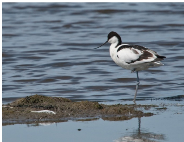
Klyde yngler i betydelig antal i Natura 2000-området.

En supplerende områdebeskrivelse findes i basisanalysen for Natura 2000-området.