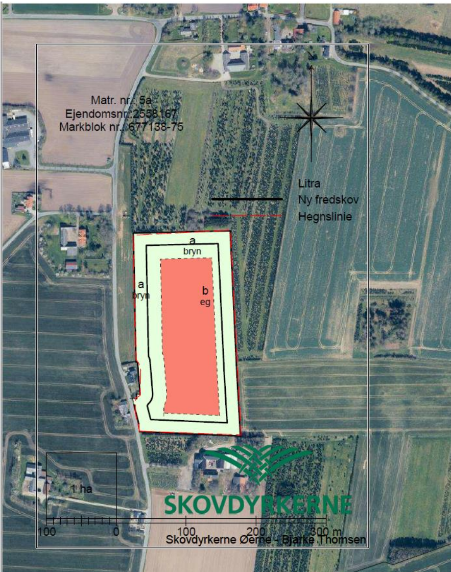
Skovkort - fra ansøgning