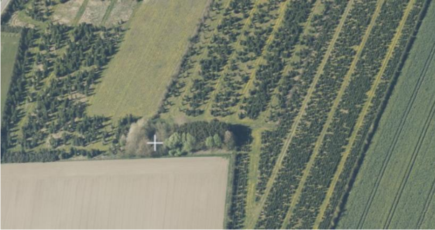
Skråfoto. Det hvide plus markerer omtrent placeringen af den beskyttede sø i den eksisterende plantning nord for skovrejsningsarealet.