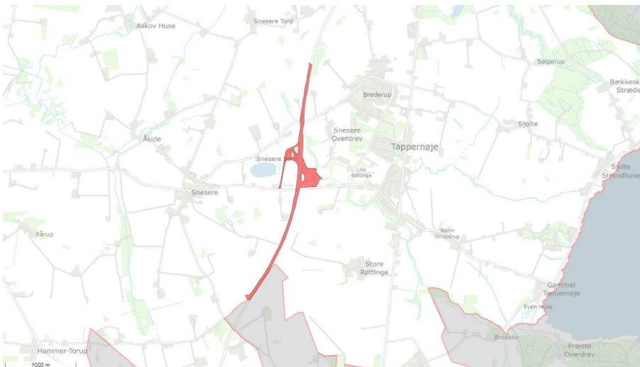
Matrikel 7000r ses med rød på ovenstående kort.

Grundens omtrentlige placering og udstrækning er indtegnet på nedenstående kort: