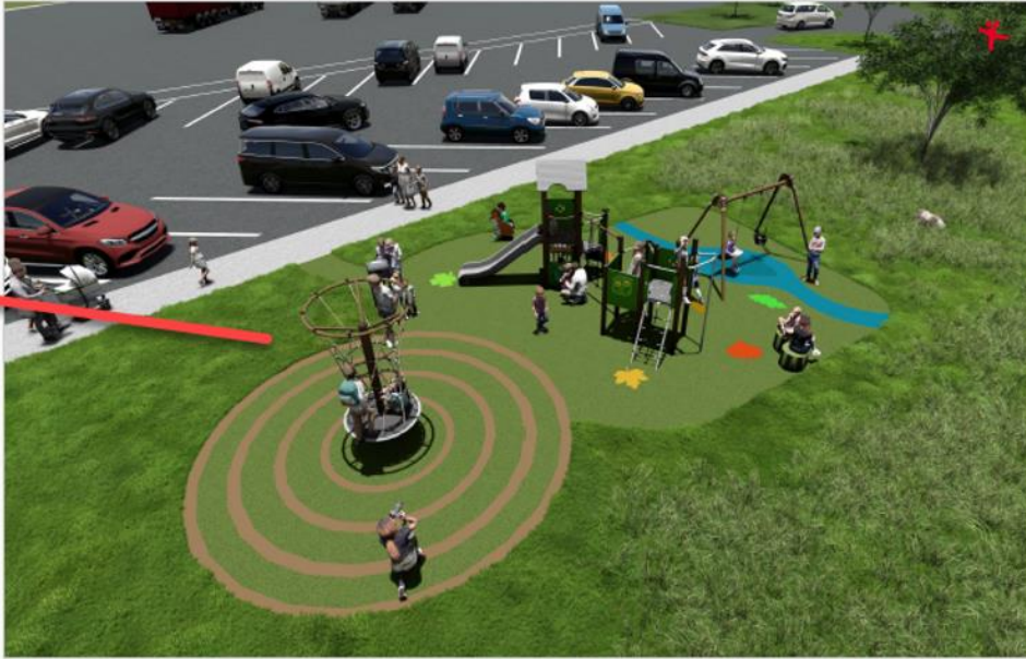
Visualisering af legepladsen fra ansøgningsmaterialet.