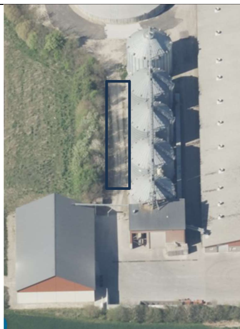
Skråfoto: Område hvor pladsen vil blive etableret ses med sort markering. Beplantning ses vest for den ansøgte plads.