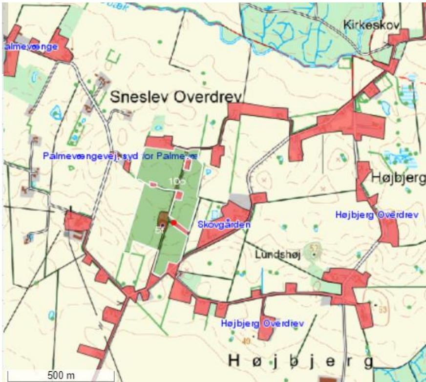
Oversigtskort over kloakopland Højbjerg Overdrev.

Pumpestationen ønskes etableret i eksisterende kloakopland Højbjerg Overdrev, som er vist på oversigtskort herunder. Som det fremgår af kortet, er der tale om afledning af spildevand fra spredt bebyggelse i et kuperet landskab.