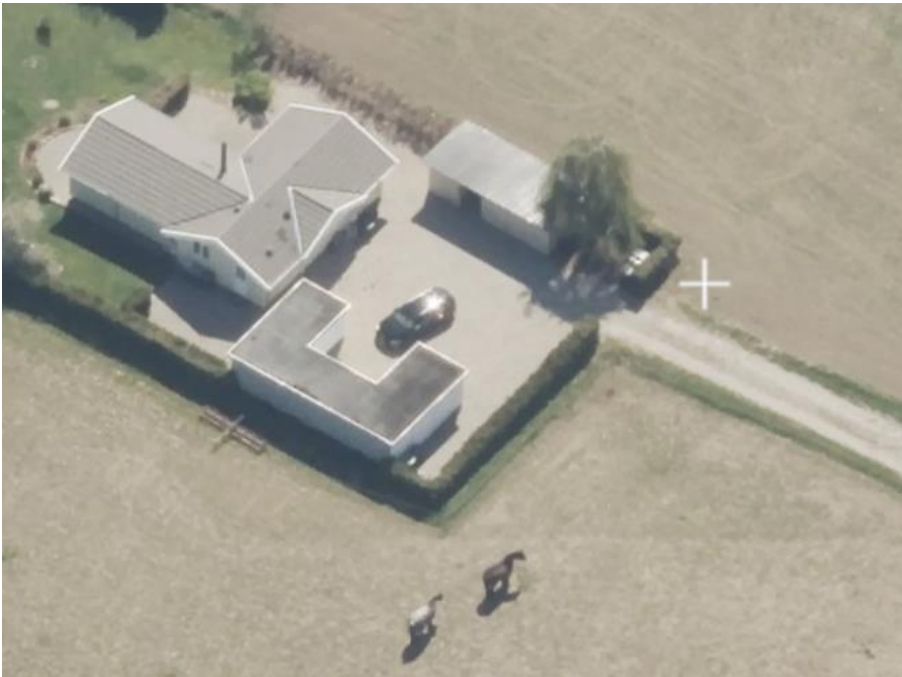
Fremtidig placering af pumpestation på udstykket areal set fra nord og vist med hvidt kryds på SDFE skråfoto maj 2023.