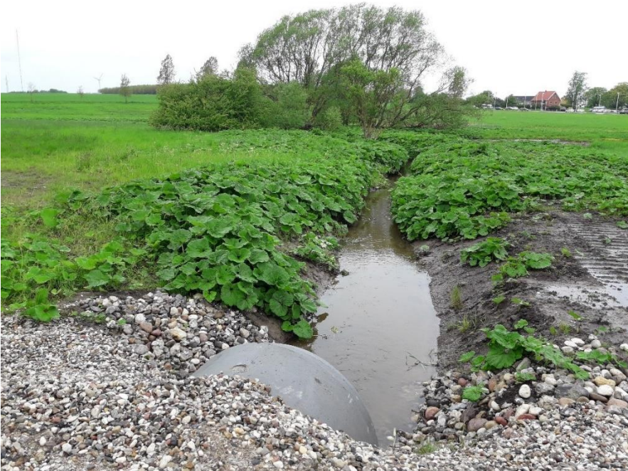
Skiddenrenden nedstrøms rørføring under servicevej. Genslyngningen laves mod venstre i billedet.

Skiddenrenden genåbnes på en matrikel, der tilhører en privat lodsejer. Arealet henlægges med græs. Arealet ligger i landzone ved Holme-Olstrup.