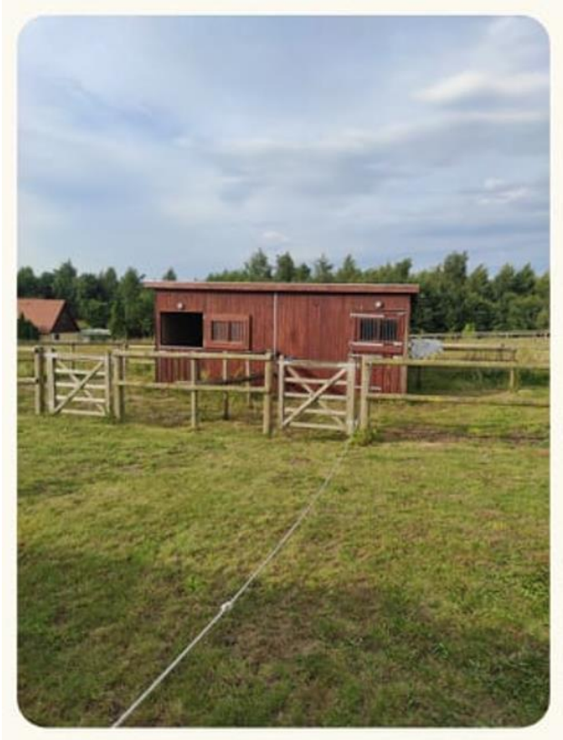
Billede af læskur fra ansøgningsmateriale.