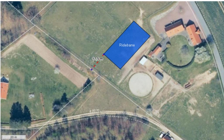
Dadevej 21, 4171 Glumsø. Afstand til skel vist med rød stiplede linje på ca. 17,5 m.

Ansøger er orienteret om bemærkningerne og vil holde afstande til naboskel.