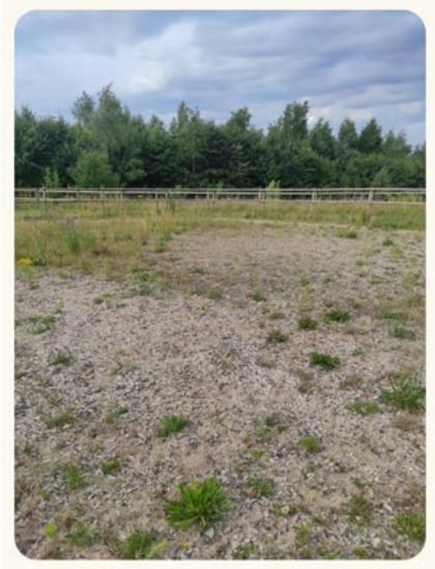
Billede af round pen fra ansøgningsmaterialet.