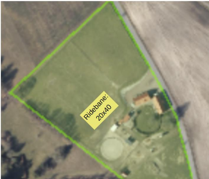
Situationsplan for ridebane fra ansøgningsmaterialet.

Situationsplan og billeder af det ansøgte ses nedenfor: