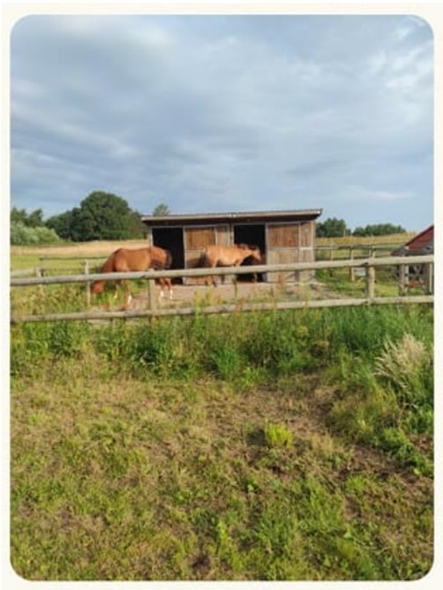
Billede af læskur fra ansøgningsmateriale.