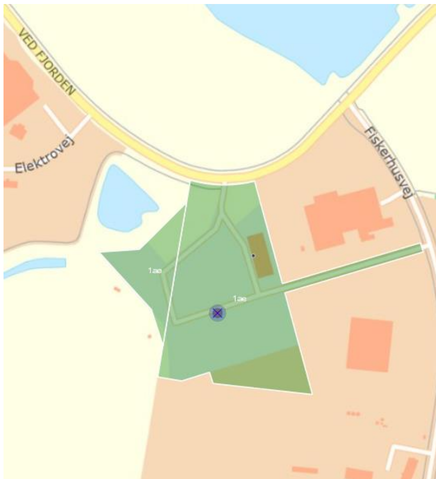
Figur 2 Genbrugspladsen er markeret med grønt