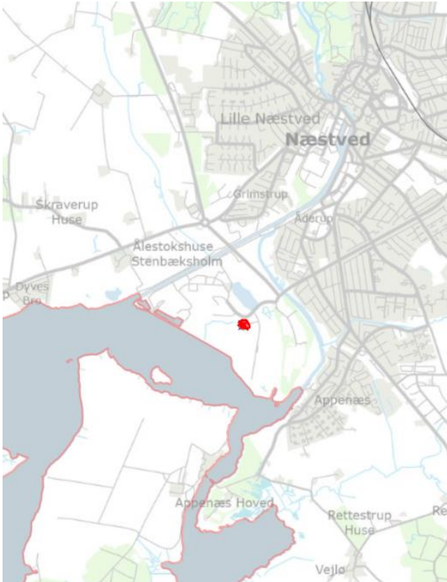
Figur 1 Næstved Genbrugsplads ligger syd for Næstved By