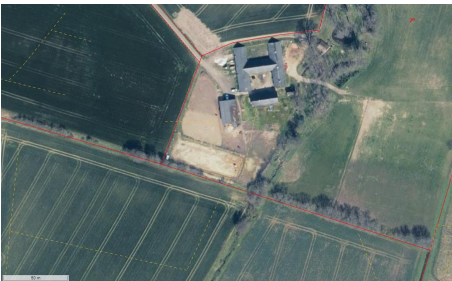
Påbegyndt ridebane ses sydvest for bebyggelseskompleks. Markdræn vist med gule stiplede linjestykker.

Hvis du ændrer i det eksisterende drænsystem, skal du sørge for, at afvandingen fra de omkringliggende arealer fortsat fungerer. Det kan du gøre ved at føre eksisterende dræn rundt i kanten af ridebanen. De skal holde samme rørdimension og drændybde.