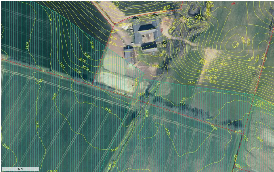
Påbegyndt ridebane ses sydvest for bebyggelseskompleks. Lavbundsareal der kan genoprettes vist med turkis skraveret areal. Højdekurver ses med gule linjestykker.

Ridebanen ligger i et område hvor der er registreret markdræn. Drænledningerne er gengivet på baggrund af HedeDanmarks gamle arkiv for drænledninger. Laget viser derfor nødvendigvis ikke alle dræninger eller nydræninger. Kortet er kun vejledende.