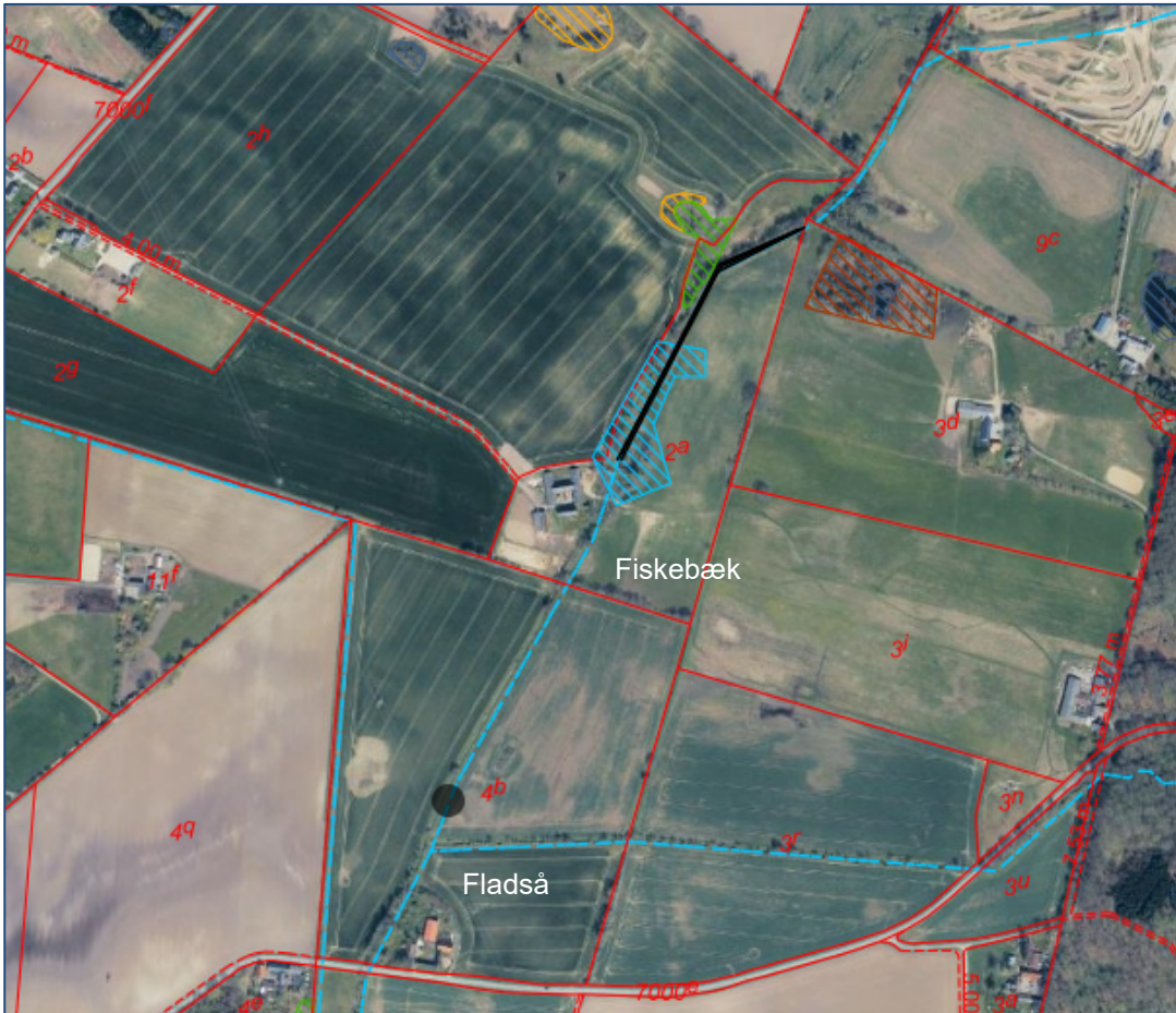
Kort 2: Matrikelkort med angivelse af projektstrækning (sort linje) og sandfang (sort cirkel). Blå linje angiver beskyttet vandløb. Blå skravering er fredet område. Grøn, gul og rød skravering er beskyttet natur.