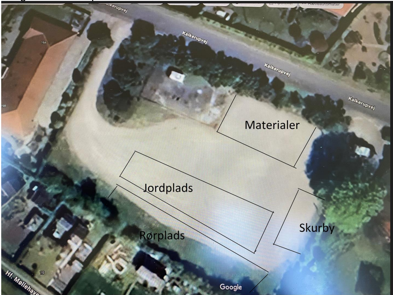
Planlagt opbygning over midlertidig arbejdsdepot Kalkerupvej 15 i Fensmark