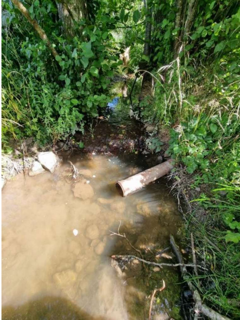
Foto 2: Udløb af rør i Fiskebæk mellem delstrækning 1 og 2 fra østlig mose på matr.nr. 3d Brandelev by, Næstelsø.