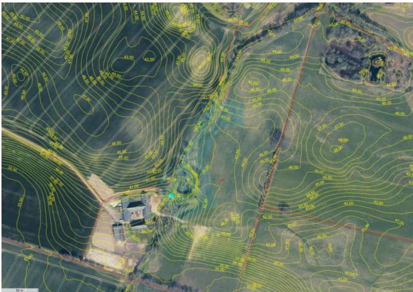
Fiskebækgård, fredskov og fredning. Den lyseblå skrå skravering viser det område, der er dækket af fredningen og den lysegrønne træsignatur fredskov. Det turkise rektangel viser placeringen af den gamle mølle.

Møllebygningen ved Fiskebækgård og landskabet tæt hertil opstrøms er fredet. Indenfor fredningen må der ikke bygges eller foretages beplantning eller rydning af træer.