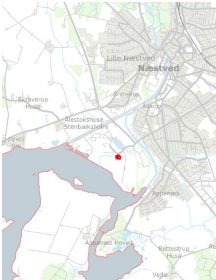
Figur 1 Næstved Genbrugsplads ligger syd for Næstved By