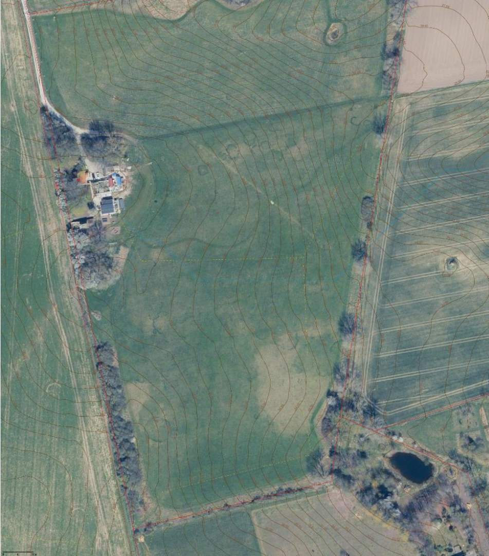
Drænsystemerne er vist med gult stiplede linjestykke.

Placeringen af dræne på kortet er behæftet med en del usikkerhed, men det ser ud til, at det nordlige dræn ligger der, hvor søen ønskes etableret. Det kræver en landzonetilladelse at etablere en sø. I denne vil fremgå vilkår om, at drænet skal føres udenom søen. Hvis der er behov for at flytte drænet, kan det gøres uden en tilladelse efter vandløbsloven, såfremt det lægges i samme dimension og dybde, således at afvandingen fra naboarealer opretholdes uændret.