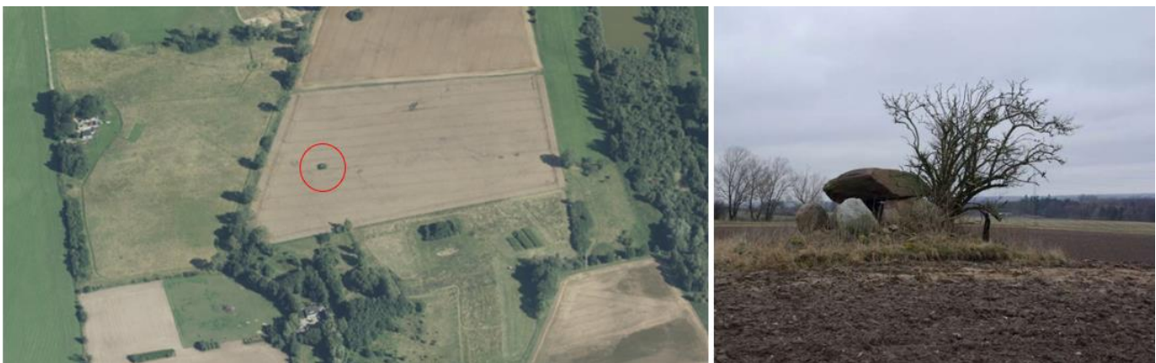
Fortidsmindets placering, markeret med rød cirkel på skråfoto og fortidsmindet på billede via Slots- og Kulturstyrelsen.

Øst for skovrejsningen er der et fritstående dysse-/gravkammer på en jordhøj, registreret med lokalitetsnr. 050401-2 og fredningsnr. 39262.