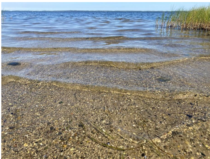
Foto 1 Stranden ved Præstø Fjord set fra stranden

Badevandets klassifikation revideres hvert år i maj måned og badevandsprofilen opdateres efter behov.