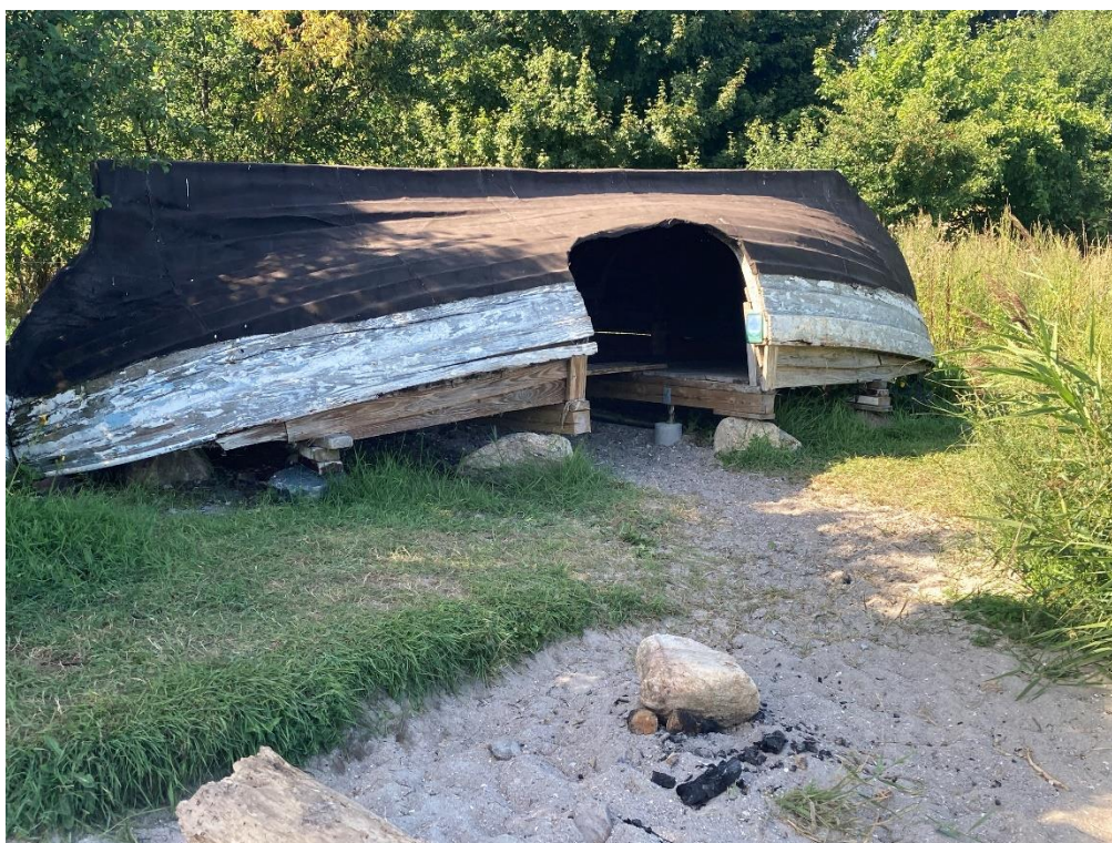
Bådshelter på stranden ved Præstø Fjord

Ca. 200 meter bag Bredeshave ligger en større shelterplads med to shelters, bålhus, drikkevand og muldtoilet.