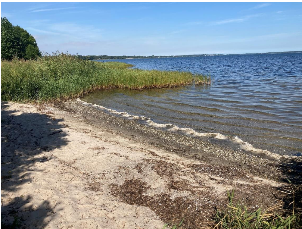
Stranden ved Præstø Fjord set fra syd

Badende ved stranden bør altid være opmærksomme på, at pludselige forureninger af badevandet kan opstå i forbindelse med uheld fra f.eks. lystbåde og kloakledninger. Hvis Næstved Kommune modtager oplysninger om forurening, der kan påvirke badevandet eller skade de badendes sundhed, vil kommunen varsle om dette på skiltet ved stranden og på kommunens hjemmeside: www.naestved.dk