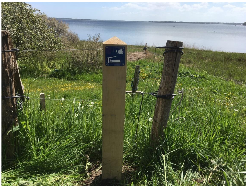
Stien ned til stranden ved Præstø Fjord

Adgang til stranden sker ad en græsbeklædt sti fra landevejen, efter man har passeret en mindre skrænt.