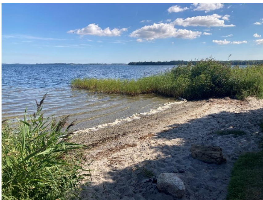
Stranden ved Præstø Fjord set fra nord

Hvis Næstved Kommune modtager oplysninger om opblomstring af sundhedsskadelige alger, vil kommunen varsle om dette på skiltet ved stranden (se oversigtskort) og på kommunens hjemmeside: www.naestved.dk .