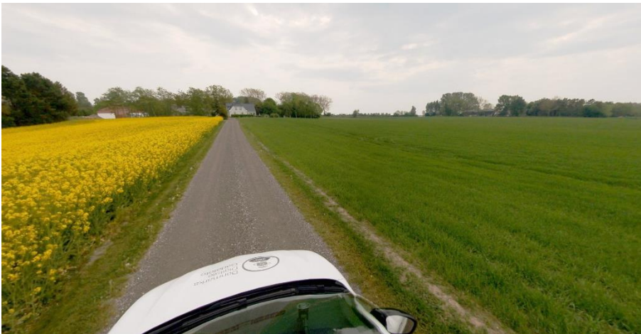
Ridebanen vil opføres på det grønne græs-/markareal langs vejen. Gadefoto kigger mod øst med stuehuset på Kristiansholmsvej 13, 4262 Sandved set i baggrunden. COWI, 2022.

Ved gennemgang af gadefotos ses terrænet – trods at være opadgående mod øst – at være forholdsvist fladt. Hertil er ejendommen beliggende i et jordbrugsbrugsområde og ikke et bevaringsværdigt landskab, hvilket har indgået i vurderingen af det ansøgte.