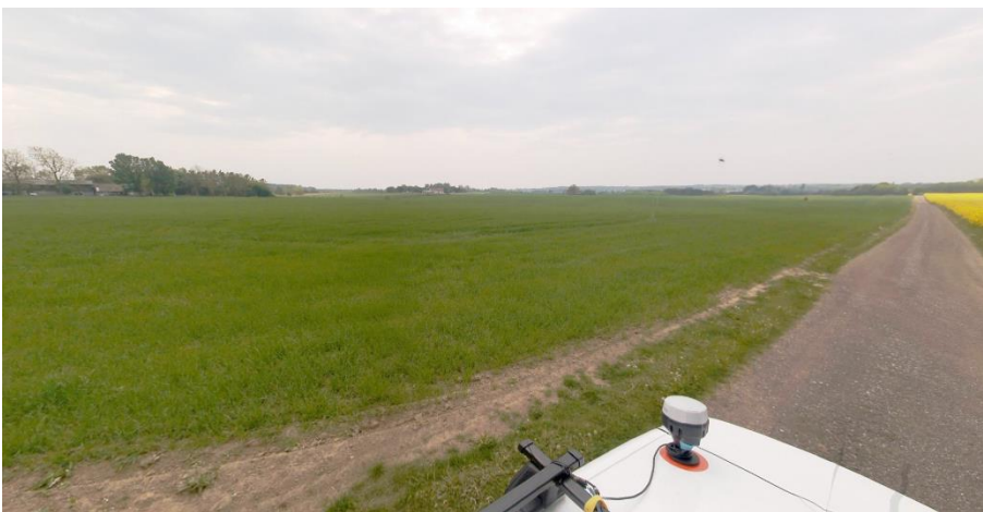
Ridebanen vil opføres på det grønne græs-/markareal langs vejen. Gadefoto kigger mod vest. COWI, 2022.