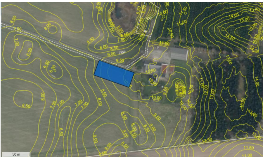
Højdekurver vist med gule linjer. Ridebane vist med blå rektangel.

Ansøger ønsker en plan ridebane i kote 9,5 m, hvilket betyder at der terrænreguleres med 0,5-1 m vest og øst i ridebanen: